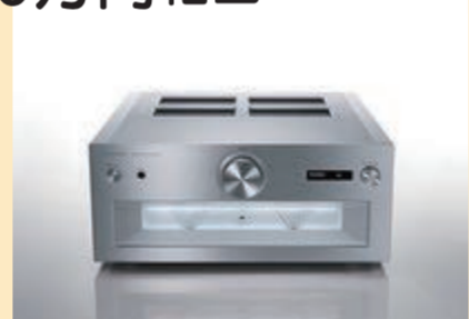
ステレオインテグレートアンプ SU-R1000 998,000円(税込)