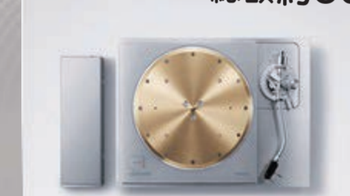
ダイレクトドライブターンテーブルシステム SL-1000R 2,000,000円(税込)