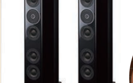
スピーカーシステム SB-R1 1,482,800円(1本)(税込)